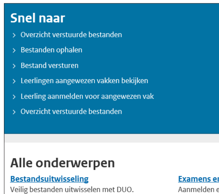
Voorbeeldscherm 'Bestanden ophalen'

Log in op Mijn DUO. Kies in het linker menu voor Bestanden ophalen.